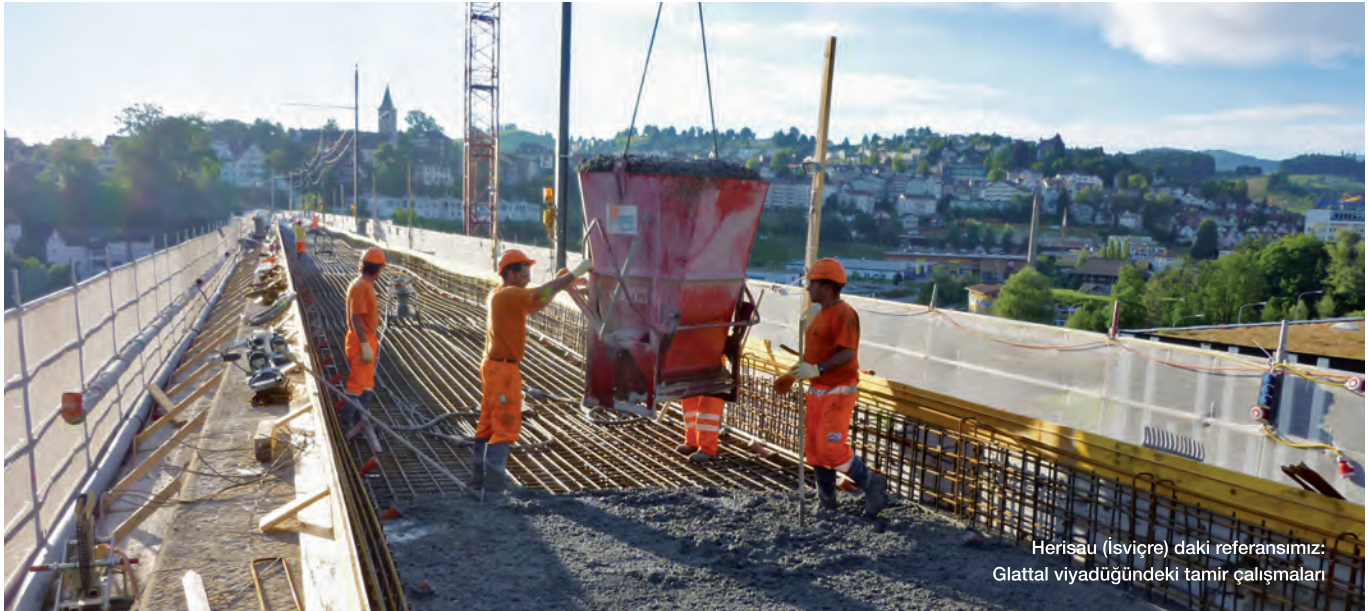
Herisau (İsviçre) daki referansımız: Glattal viyadüğündeki tamir çalışmaları