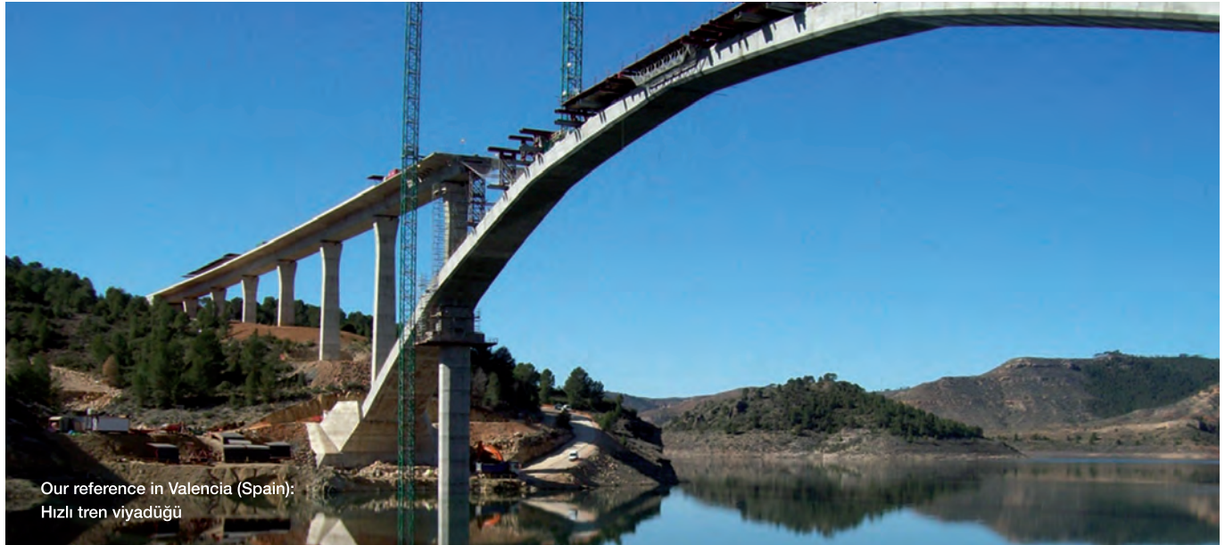
Our reference in Valencia (Spain): Hızlı tren viyadüğü

MasterGlenium SKY'ın molekül yapısı özellikle erken dayanım gelişimi için çok önemlidir. Geleneksel polikarboksilat eter esaslı süperakışkanlaştırıcı molekülleri çimento taneciklerinin yüzeyini tamamen kaplar ve suyla temas etmesini engeller. Böylece hidratasyon süreci yavaşlar. Buna karşılık MasterGlenium SKY molekülleri çimento tanecikleri üzerinde ani hidratasyona izin veren boşluklar bırakarak erken yüksek dayanım gelişimine olanak sağlar.