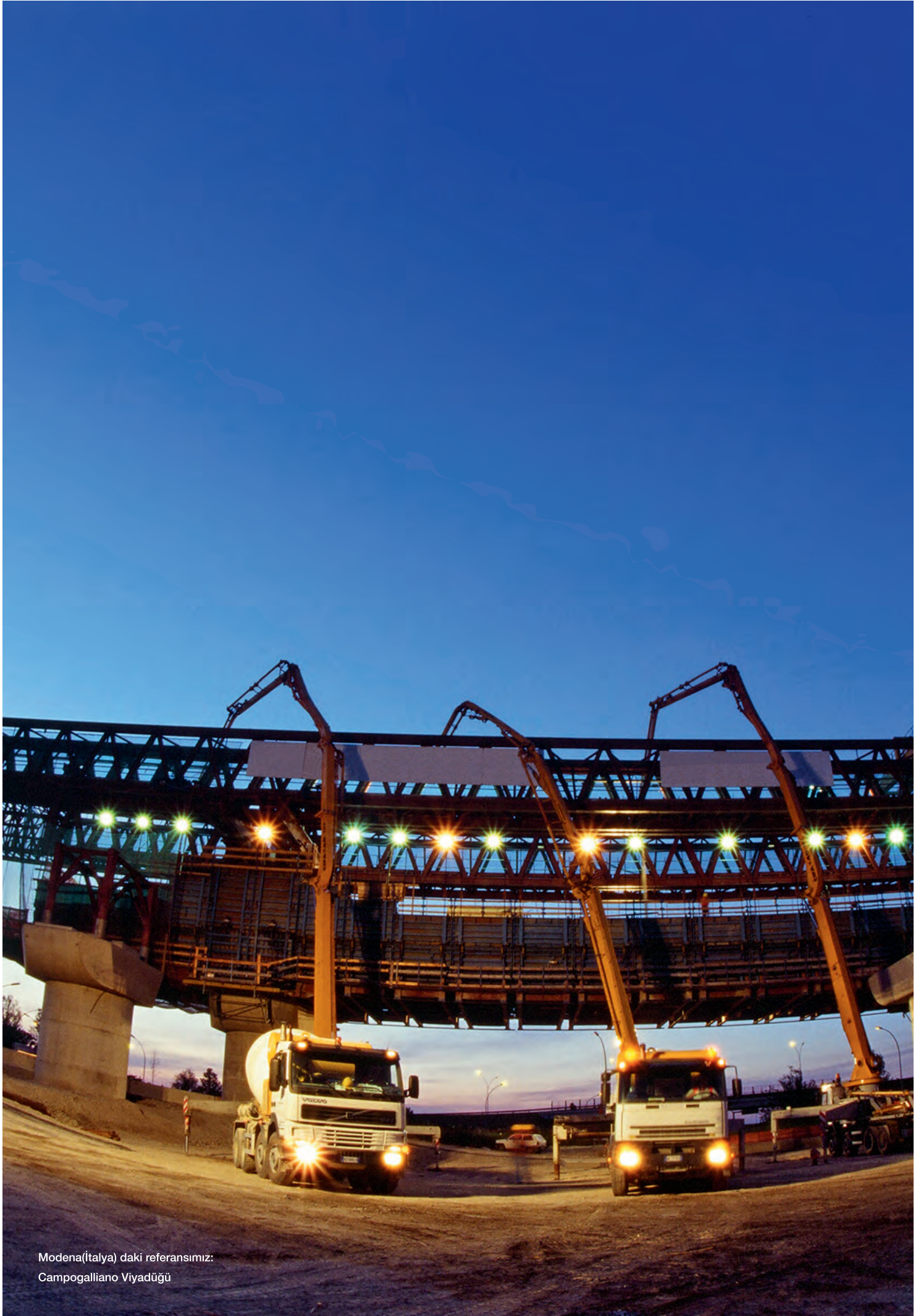
Modena(İtalya) daki referansımız: Campogalliano Viyadüğü