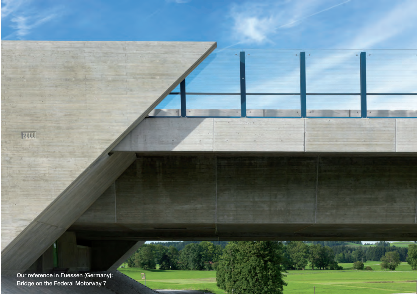
Our reference in Fuessen (Germany): Bridge on the Federal Motorway 7

Toplam Performans Kontrolü kavramının ana bileşeni MasterGlenium SKY süperakışkanlaştırıcı beton katkıdır.