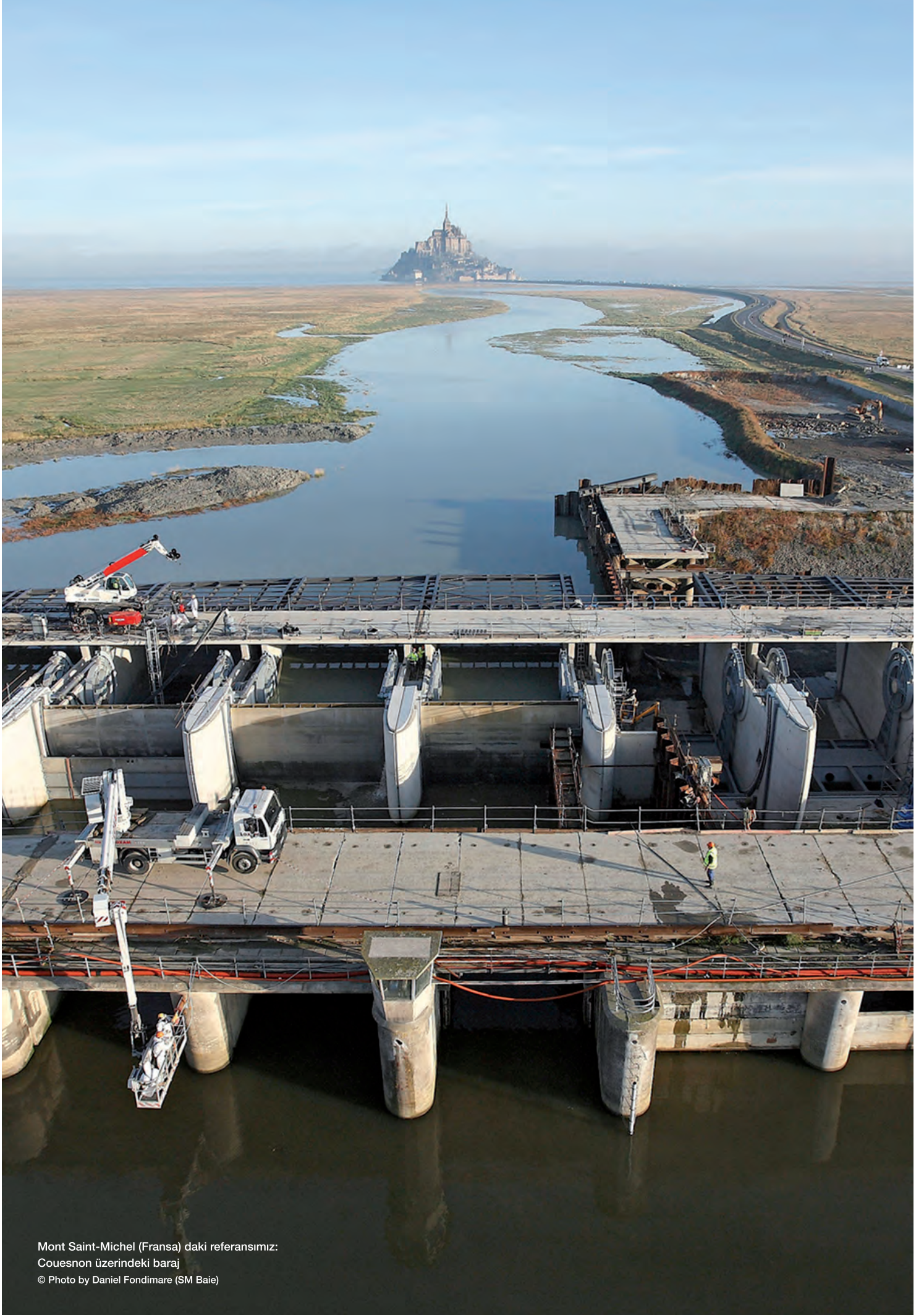
Mont Saint-Michel (Fransa) daki referansımız: Couesnon üzerindeki baraj